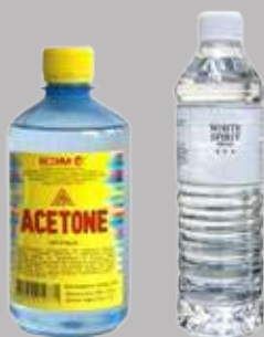
Ацетон или уайт-спирит