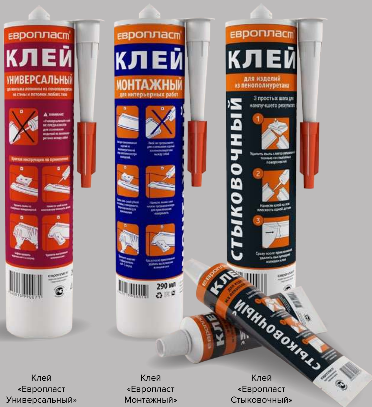
Клей «Европласт Универсальный»