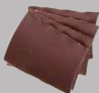
Мелкозернистая наждачная бумага