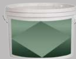
Мелкозернистая водорастворимая шпаклевка