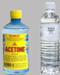
Ацетон или уайт-спирит