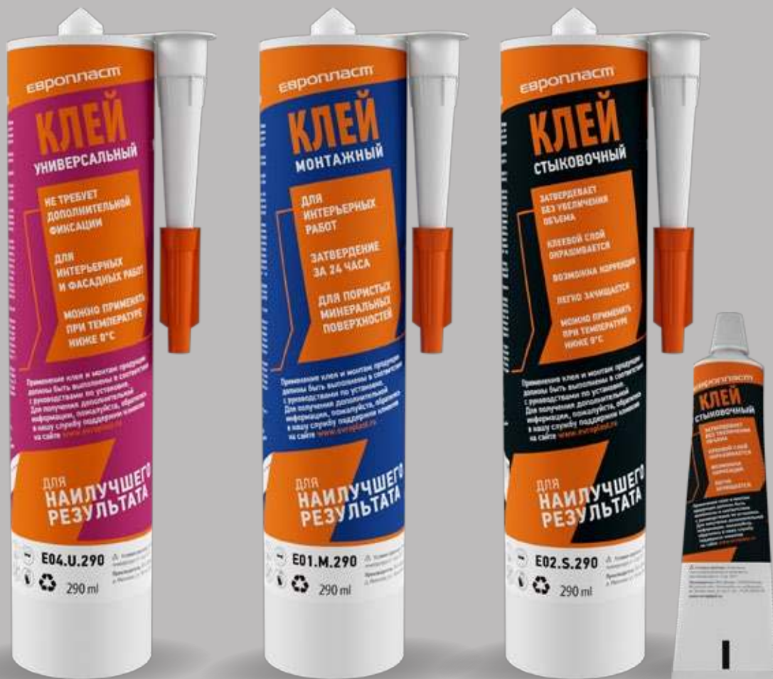
Клей «Европласт Универсальный»