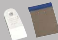
Резиновый и металлический шпатели