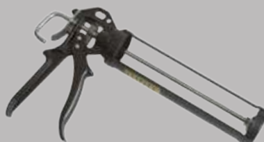
Пистолет под клей